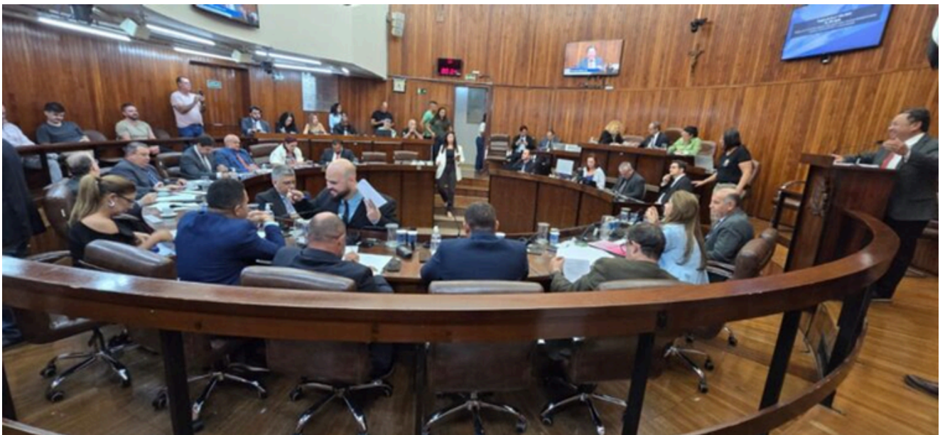
Sala de Sessões “Dr. Lourenço de Almeida Senne”

As sessões da Câmara Municipal de Marília constituem reuniões formais destinadas à deliberação e ao desenvolvimento dos trabalhos legislativos. Em regra, são abertas ao público e transmitidas ao vivo pelos canais oficiais desta Casa de Leis, realizadas no recinto próprio de funcionamento, salvo em situações de impossibilidade ou em ocasiões solenes específicas. Classificam-se, fundamentalmente, em sessões ordinárias, extraordinárias, solenes ou especiais, tribuna livre e audiência pública, havendo ainda previsão regimental para sessões secretas. Durante sua realização, exige-se conduta compatível com o decoro parlamentar, sendo obrigatório a vereadores e funcionários o uso de paletó e gravata (salvo dispensa pelo Plenário), além da manutenção dos aparelhos celulares no modo silencioso.