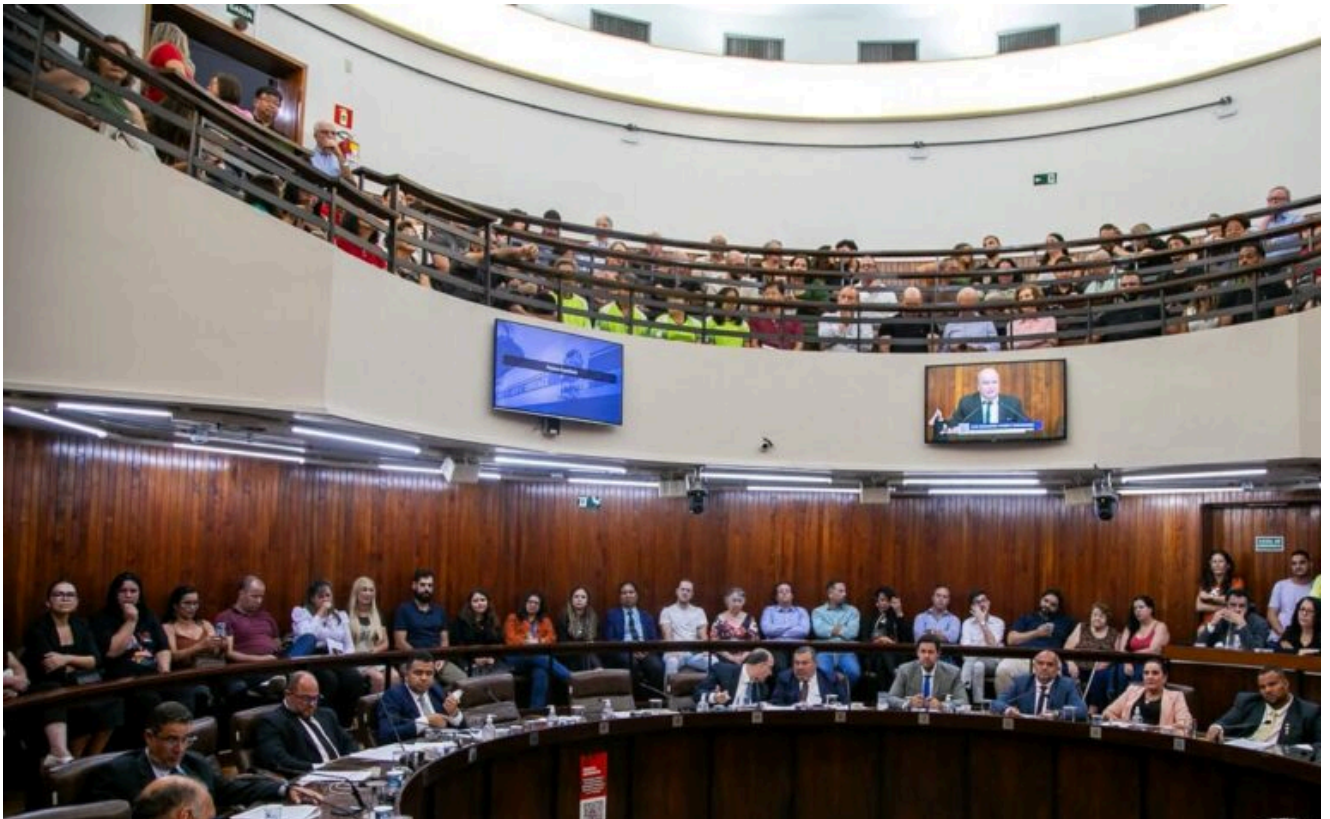
Sala de Sessões "Dr. Lourenço de Almeida Senne".

A Tribuna Livre é um espaço destinado à participação da população, realizado nas segundas quintas-feiras de cada mês, a partir das dezesseis horas, com duração improrrogável de uma hora e trinta minutos. Para que a sessão se concretize, ela depende da existência de interessados, ou seja, a Tribuna Livre somente ocorre quando há algum munícipe previamente inscrito. Essa inscrição deve ser feita de forma pessoal e intransferível na Secretaria da Câmara com pelo menos cinco dias úteis de antecedência, informando obrigatoriamente o responsável, o orador e o tema exato que será abordado, além de exigir a entrega de um termo declarando o conhecimento do Regimento Interno da Casa e da Constituição Federal. O tempo total é então dividido: a primeira hora é exclusiva para até quatro representantes da comunidade, com limite de quinze minutos de fala para cada, e os trinta minutos finais são reservados aos vereadores.