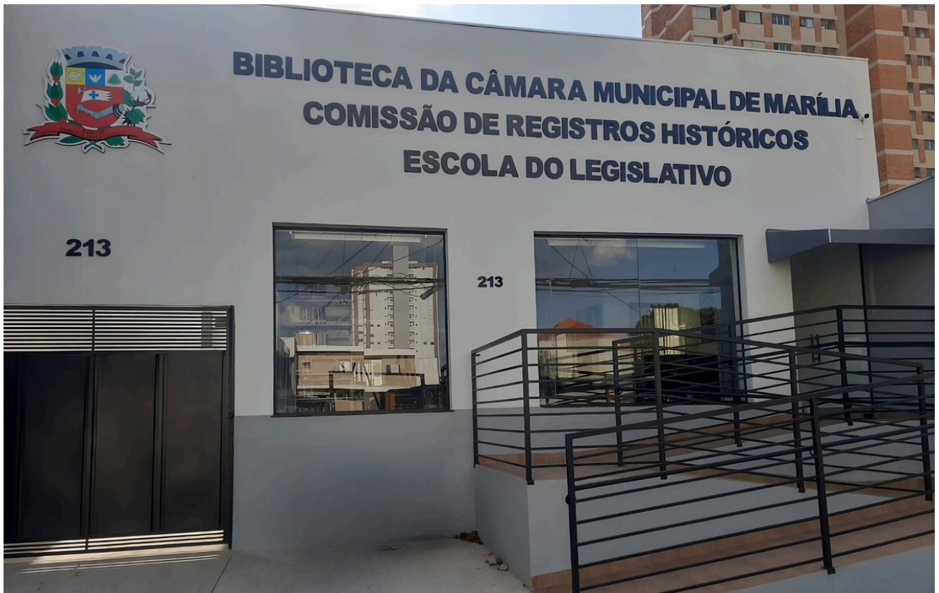
Fachada da Biblioteca "Rangel Pietraroia"

A Biblioteca Municipal Rangel Pietraroia realiza atendimento ao público de segunda a sexta-feira, exceto em feriados e pontos facultativos, no horário das 7h às 17h. O serviço fica localizado na Avenida Carlos Gomes, nº 213, Centro.