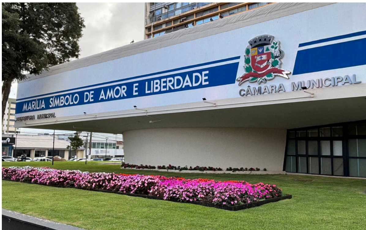
Fachada da Câmara Municipal de Marília

A Câmara Municipal de Marília é a sede do Poder Legislativo local e o principal fórum de debates da nossa sociedade. Composta por representantes eleitos diretamente pelo povo, a Casa atua como o equilíbrio fundamental da democracia municipal, desempenhando quatro funções primordiais: