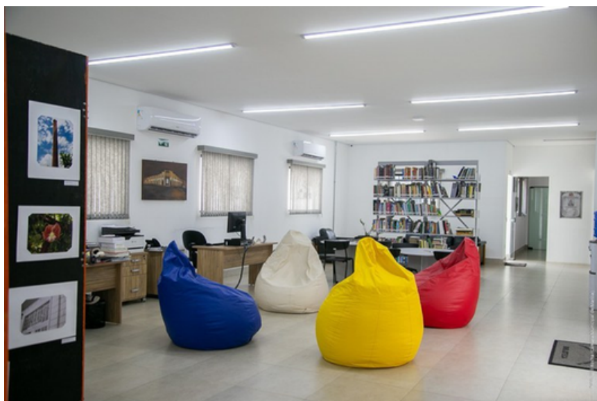
Interior da Biblioteca “Rangel Pietraroia”

O acervo da biblioteca é composto por uma vasta coleção técnica e histórica, com ênfase especial em áreas como legislação, políticas públicas, história local e municipal e outras áreas de interesse público e administrativo. Além de livros e manuais especializados, o setor mantém sob sua guarda documentos de valor inestimável para a compreensão da trajetória legislativa da cidade, incluindo coleções completas de Diários Oficiais, leis municipais, resoluções e decretos que remontam às décadas passadas. A biblioteca também atua como um elo entre o cidadão e a legislação local, auxiliando na localização de normas específicas e fornecendo subsídios técnicos para que os vereadores e seus assessores fundamentem seus projetos e decisões.