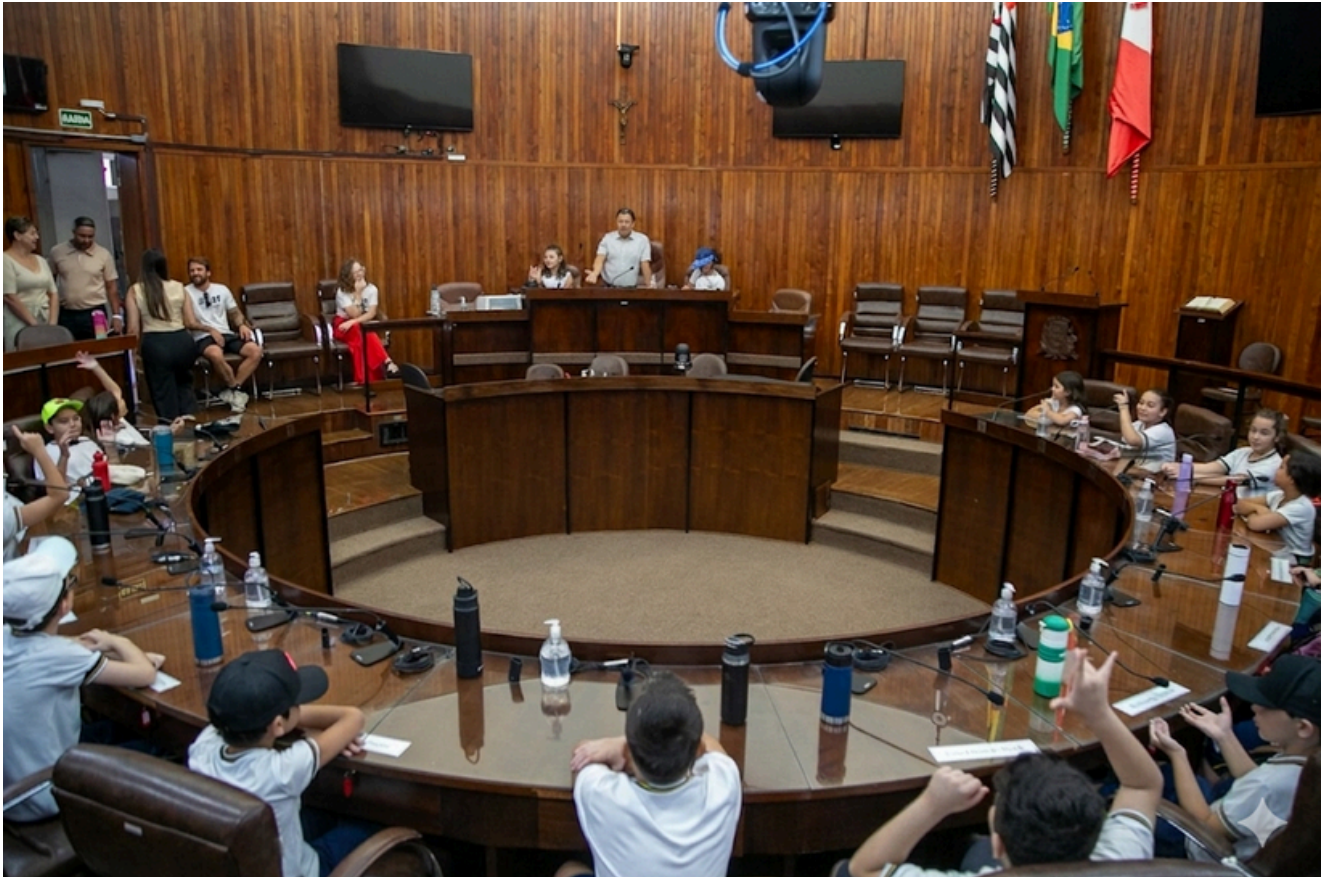
Visita orientada para alunos do ensino fundamental

presidência de um vereador. Para garantir o conforto e a segurança de todos, o programa prevê adaptações logísticas para turmas numerosas, assegurando que o propósito educativo seja cumprido de maneira inclusiva e eficiente.